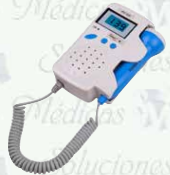
Doppler fetal portátil con pantalla LCD Azul 2.5 MHz. HC-HC-JPD-100B