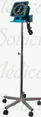
Baumanómetro anerode con pedestal HERGOM K-B13-0

c/ estetos simplex $ 505.00 c/ estetos dúplex $ 530.00 c/ est. rappaport $ 780.00