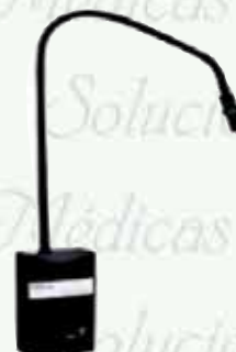
Lámpara de exploración multiangulos pared y piso 50 Wts. LED K-L202-1