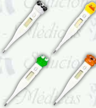
Termómetro digital pediátrico K-ECT-10 PA/PT/PE/RA