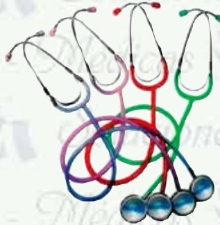
Estetoscopio pediátrico doble transparente K-E2-TD