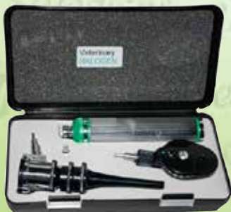
Estuche de diagnóstico luz halógeno veterinario Gowlland K-3124H