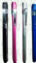
Lámpara para diagnóstico HomeCare HC-LAMP- P / A / LED

Plástica $ 60.00 Metálica $ 100.00 Luz de LED $ 135.00