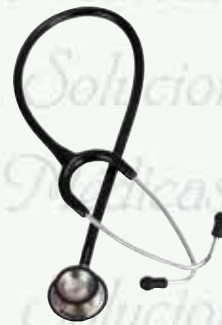
Estetoscopio pediátrico dúplex HomeCare HC-HC-800