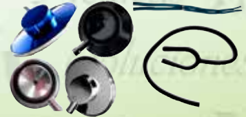
Campanas y mangueras para estetoscopio K-RE# / HC-HC-505