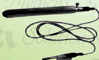
Lámpara vaginal con adaptador para espejo K-LV