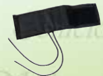
Brazal para Baumanómetros HERGOM K-RB

adulto c/camara $125.00 adulto s/camara $ 70.00 infantil c/camara $ 125.00 neonatal c/camara $ 125.00 neonatal s/camara $ 70.00 sobre peso c/camara $ 145.00 sobre peso s/camara $ 85.00 pediátrico c/camara $ 125.00 pediátrica s/camara $ 70.00