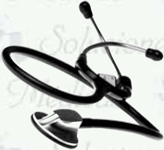
Estetoscopio Premier Lux K-E4