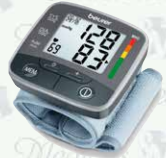
Baumanómetro digital de muñeca Beurer K-BC32