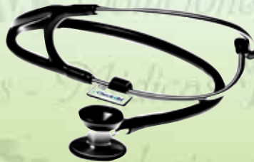
Estetoscopio cardiológico K-E8