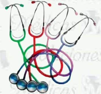
Estetoscopio pediátrico simple transparente K-E2-TS