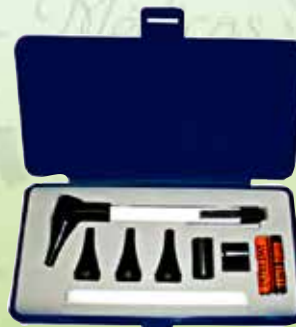
Otoscopio con lámpara y accesorios económico K-KT-GF08P