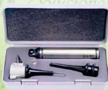
Estuche de diagnóstico otoscopio oftalmoscopio veterinario Gowlland K-3124