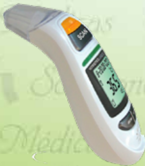
Termómetro infrarrojo fecha, hora, con voz y luz en pantalla 7 en 1 HC-HC-TS42