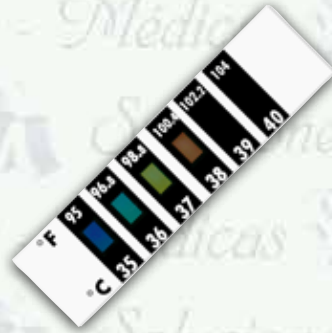
Termómetro adherible frontal K-TD500