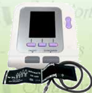
Baumanómetro digital de escritorio veterinario K-B15V