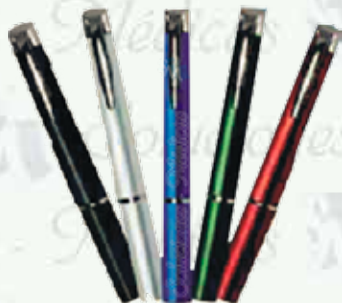
Lámpara para diagnóstico Hergom K-L100-1