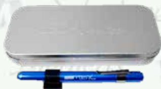
Lámpara de diagnóstico con estuche metálico K-L150