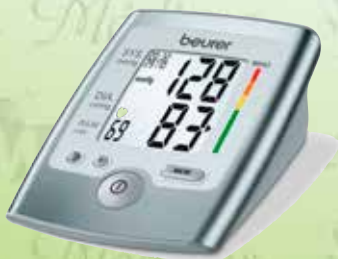
Baumanómetro digital de escritorio Beurer K-BM35