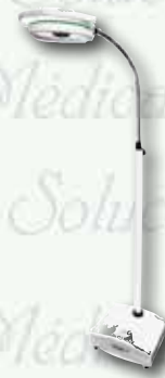
Lámpara multi LEDS de pedestal con batería para emergencia. K-L202D-3