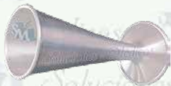
Estetoscopio de pinar AI-ESPI