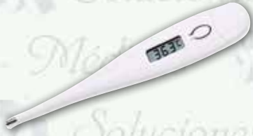
Termómetro digital Rígido K-TD100

"Equipando a los profesionales de la salud"