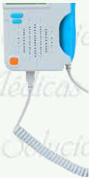
Doppler fetal portátil con pantalla LCD Blanca 2.5 MHz. HC-HC-JPD-100B+