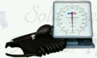
Baumanómetro anerode de pared HomeCare HC-HC-4000