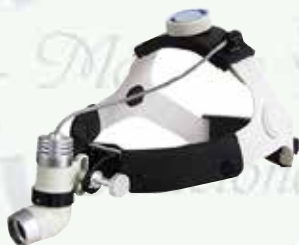
Lámpara frontal con estructura ajustable K-L202A