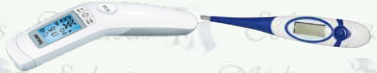
Termómetro digital clínico K-FT90