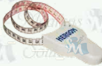
Cinta métrica Siluet K-R12