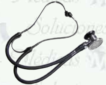
Estetoscopio Rappaport Home Care HC-HC-400