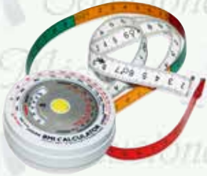
Cinta métrica BIM K-R18