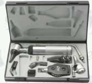
Estuche de diagnóstico Timesco HC-TM-2502.300.50