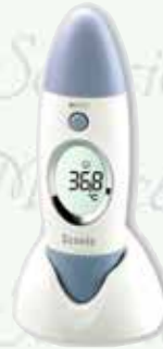
Termómetro infrarrojo Oído, frente y ambiente 3 en 1 HC-HC-TS8