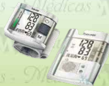
Baumanómetro digital Hergom K- BM19 / BC19 Brazales para