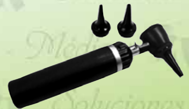
Otoscopio universal con luz estándart K-D-100