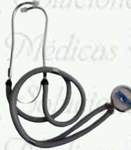
Estetoscopio Rappaport K-E3