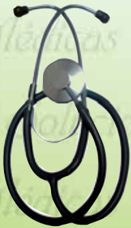
Estetoscopio pediátrico Simplex HomeCare HC-HC-700