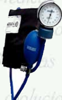
Baumanómetro anerode Economico HERGOM K-B2 S/D