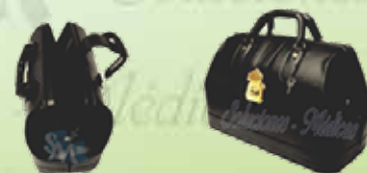
Maletín tradicional K-M2- P / V