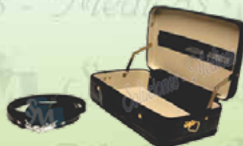
Maletín enfermería vinil con correa K-M1-VC