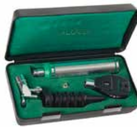
Estuche de diagnóstico halógeno Gowllands K-64404