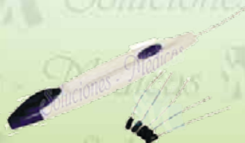
Lápiz de sensibilidad HERGOM K-GF19