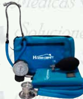
Kit baumanometro con estetoscopio Rappaport HC-2400

c/ estetos simple $ 405.00 c/ estetos doble $ 425.00