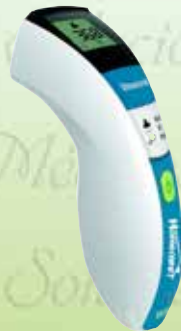
Termómetro infrarrojo Sin contacto 5 en 1 HC-HC-TS7