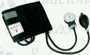
Baumanómetro anerode HomeCare HC-HC- 1000

"Equipando a los profesionales de la salud"