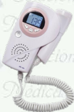
Doppler fetal portátil con pantalla LCD Blanca 3.0 MHz. HC-HC-JPD-100A