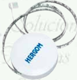
Cinta métrica Mini Bite K-R13