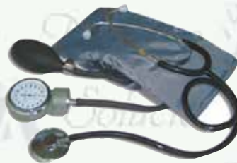
Baumanómetro anerode Popular HERGOM K-B1 S/D

c/ estetos simple $ 495.00 c/ estetos doble $ 515.00