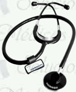
Estetoscopio adulto simple K-E1-S

"Equipando a los profesionales de la salud"