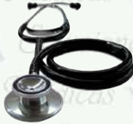
Estetoscopio adulto doble K-E1-D