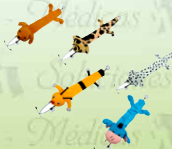
Funda para estetoscopio KF- AB/BU/CO/DA/OS/PE